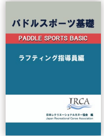
パドルスポーツ基礎 JRCA編 JRCA事務局・刊 / ¥1,980(税込)