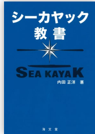
シーカヤック教書 内田正洋・著 海文堂・刊 / ¥1,540(税込)