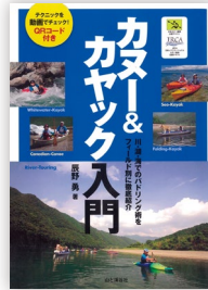
カヌー&カヤック入門 辰野勇・著 山と溪谷社・刊 / ¥1,760(税込)